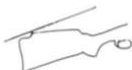
Monte Carlo Tus